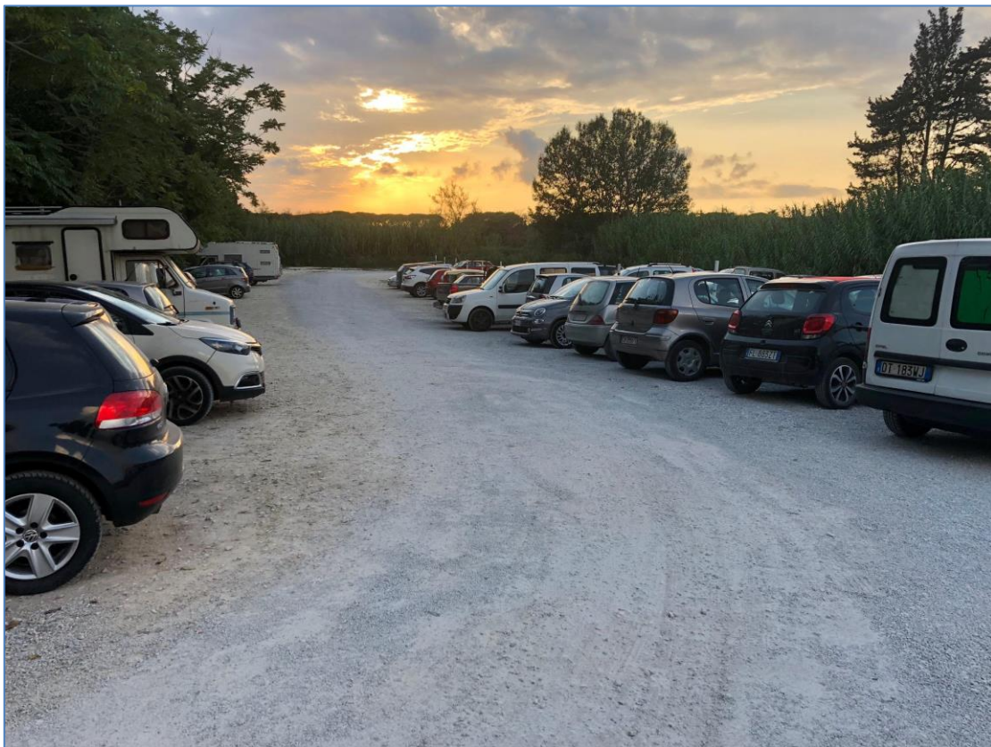
Attuale stato dell'area oggetto dell'istanza

Visto che comunque un terreno è, come mostrano le immagini, adibito a parcheggio, non solo, ma anche cosperso di ghiaia bianca che in parte potrebbe impermeabilizzare il suolo e che in ogni caso occupa un'area agricola, visto che il cambio d'uso non è stato ottenuto, a causa del mancato permesso dal Genio Civile.