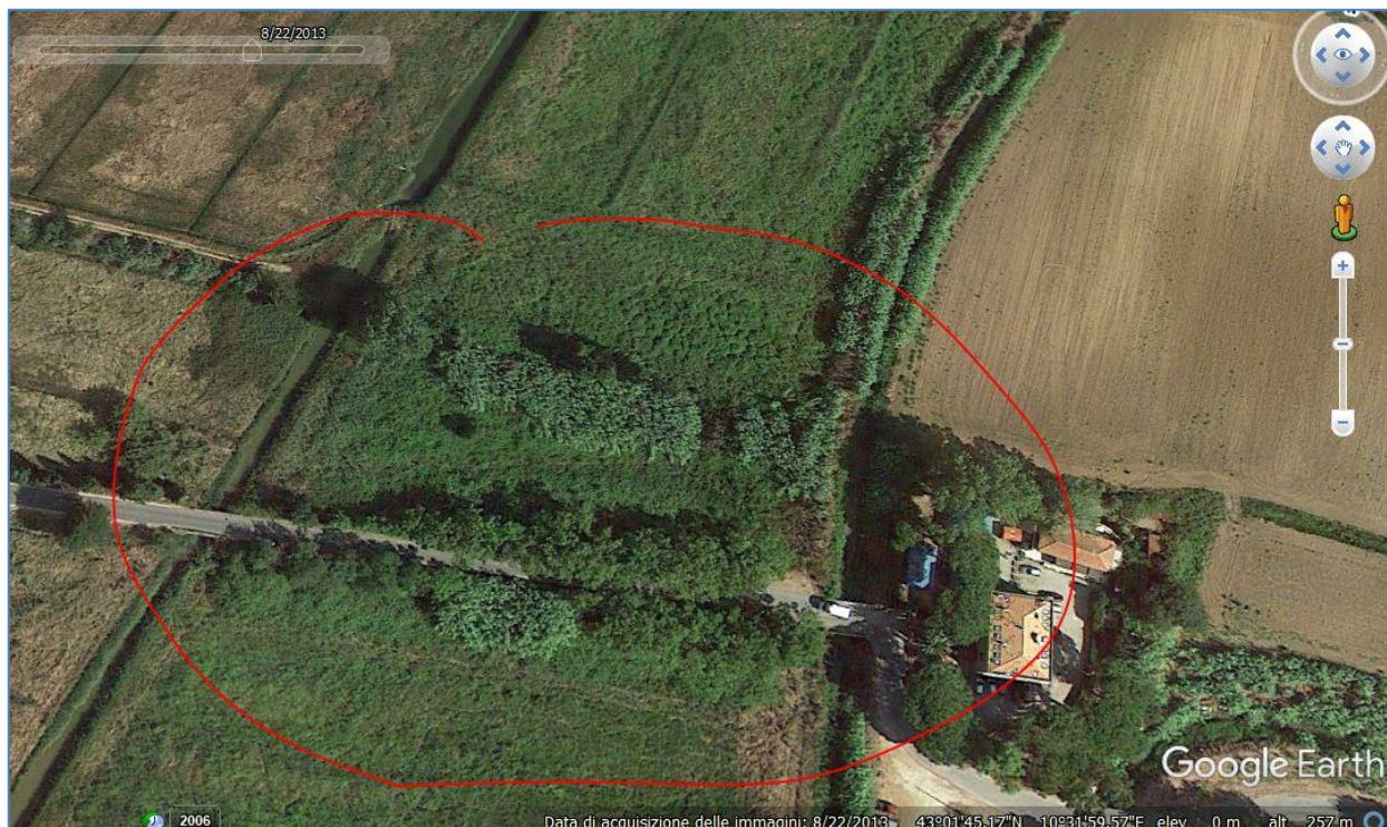
Vista area: stato dei luoghi anno 2013

L'Area in oggetto dovrebbe, secondo la relazione tecnica, misurare una dimensione di 1800m 2 , attualmente destinata ad uso seminativo . Per renderla usufruibile dalla Park Albatros sas, oggi Figline Agriturismo spa, deve subire un cambio di uso .