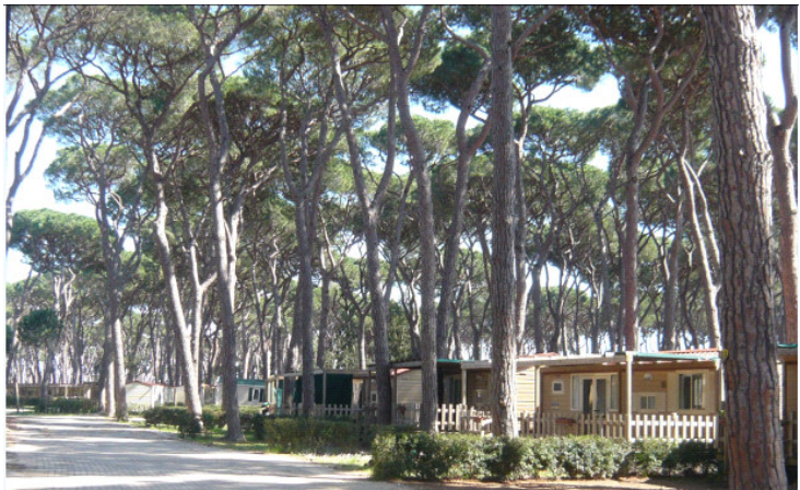
Part. n°233 "il Pinetone" stato attuale

Tutti i manufatti installati (case mobili) non hanno implicato tagli delle alberature esistenti ed hanno le seguenti caratteristiche: