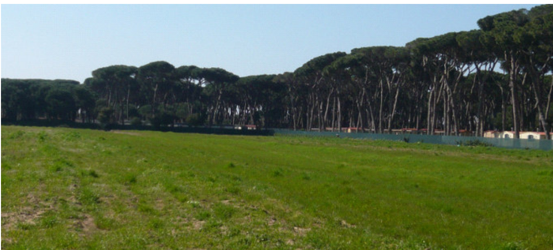
Il campo è la Part. n°172 mentre oltre la rete è la Part. n°233 del Piano Attuativo denominato “il Pinetone”