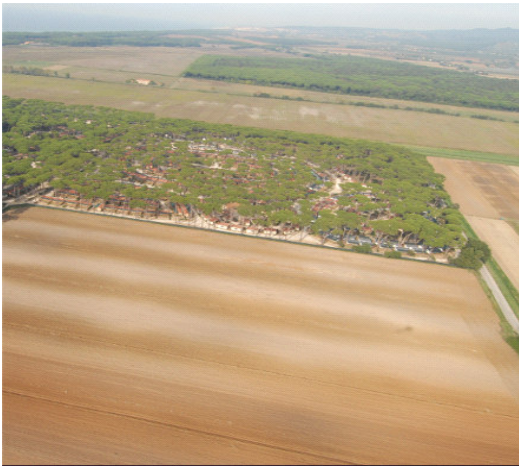
Part. n°172 (campo arato) Part. n°233 (pineta)