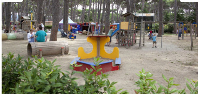
Camping Village Park Albatros: Stato attuale