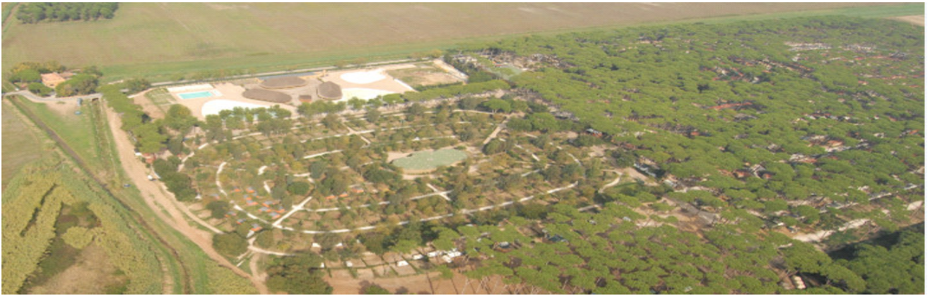
Park Albatros. Vista dall'Alto

L'area occupata dal Camping Village è circa 218.784 mq ed è contraddistinta al Nuovo Catasto Terreni al foglio n° 24, Part. n° 31